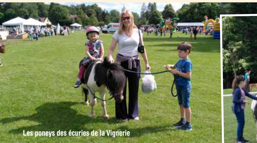
Les poneys des écuries de la Vignerie