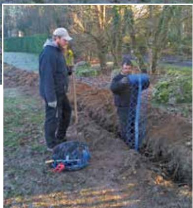
Un point d'eau extérieur pour le tennis et les fêtes.