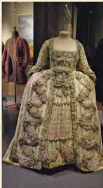
Exposition "des Visiteurs, des Ambassadeurs et des Princes au château de Versailles"