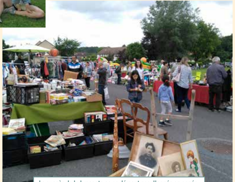
Le succès de la brocante ne se dément pas d'année en année.