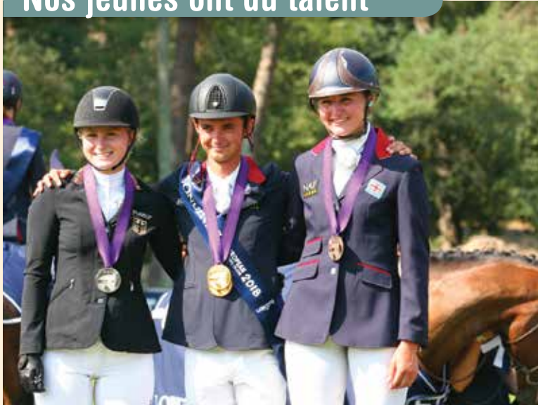
Double champion d'Europe 2018 (individuel et équipe) à Fontainebleau