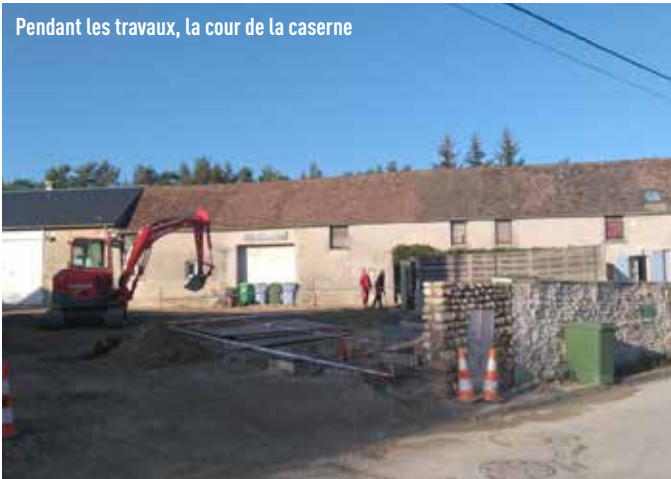
Pendant les travaux, la cour de la caserne

Les travaux ont été réalisés au dernier trimestre 2018 et la pose des clôtures et du portail devrait se faire au mois de janvier. La placette desservant la caserne étant communale, la Commune a participé au montant des travaux à hauteur de 20 000 €.