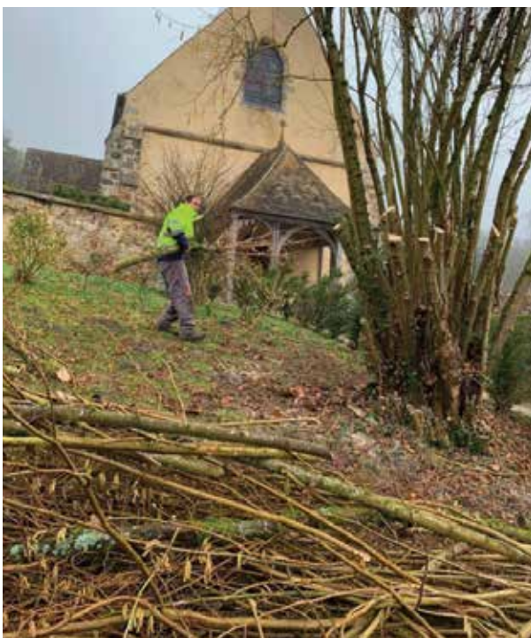
Dans le jardin du presbytère, grand nettoyage.