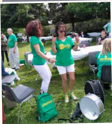
Les Batucachapos toujours très appréciés.