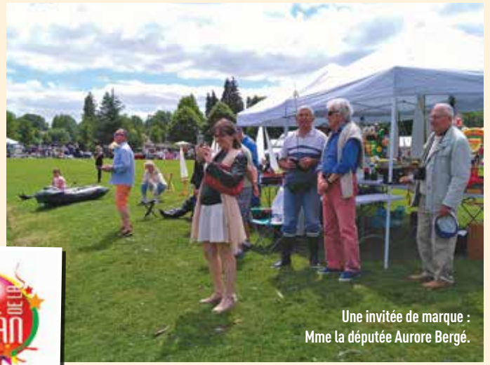
Une invitée de marque : Mme la députée Aurore Bergé.