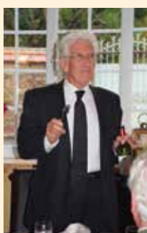
La journée se termina en musique.