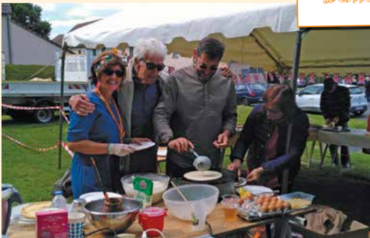
Restauration assurée par St Léger Jumelage