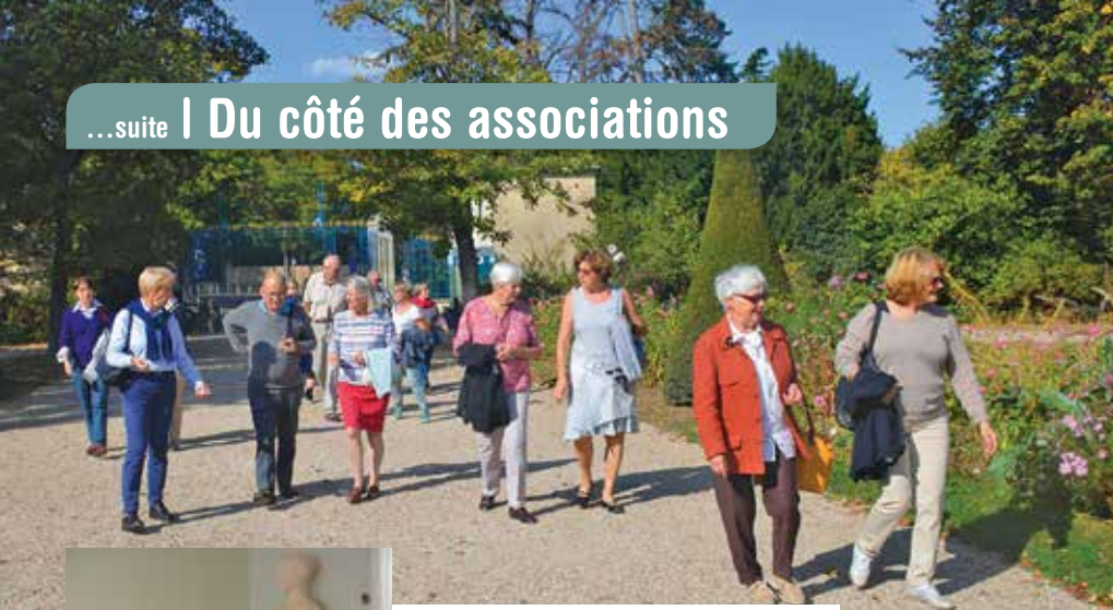
Au château de Rueil Malmaison

Véronique Dupont 06 13 20 65 14 thierryvero.dupont@cegetel.net Virginie Quinet-Cathala 06 75 09 73 78 virginiequinetcathala@yahoo.fr