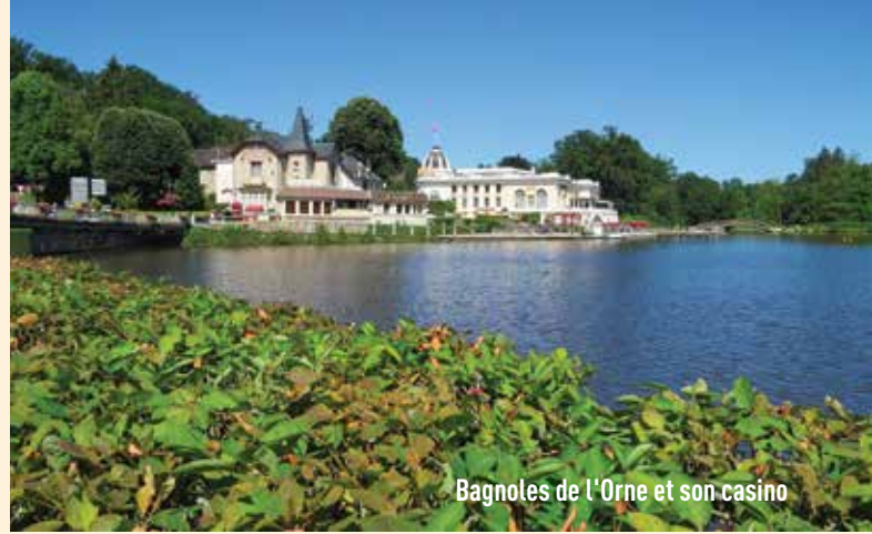
Bagnoles de l'Orne et son casino

aux saveurs du terroir dans une ancienne grange en pierre : simple mais très apprécié.