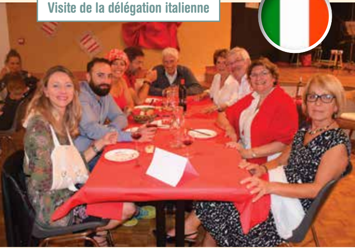
Saint-Léger à l'heure italienne avec Saint-Léger jumelage.