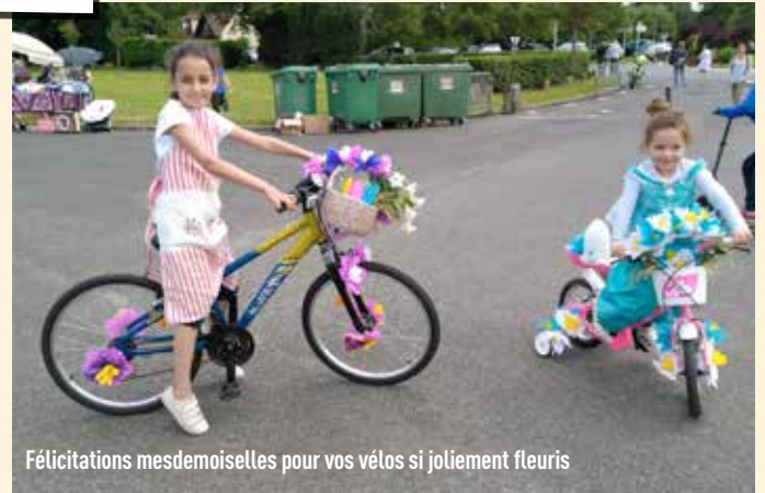
Félicitations mesdemoiselles pour vos vélos si joliment fleuris