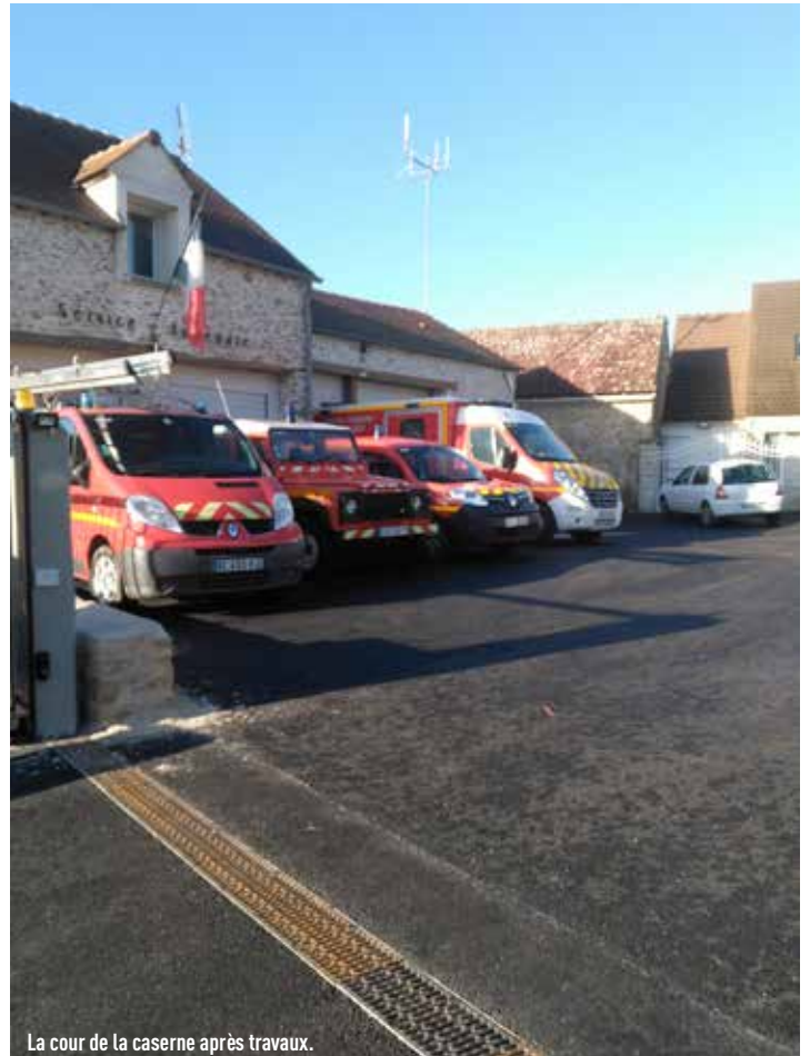
La cour de la caserne après travaux.