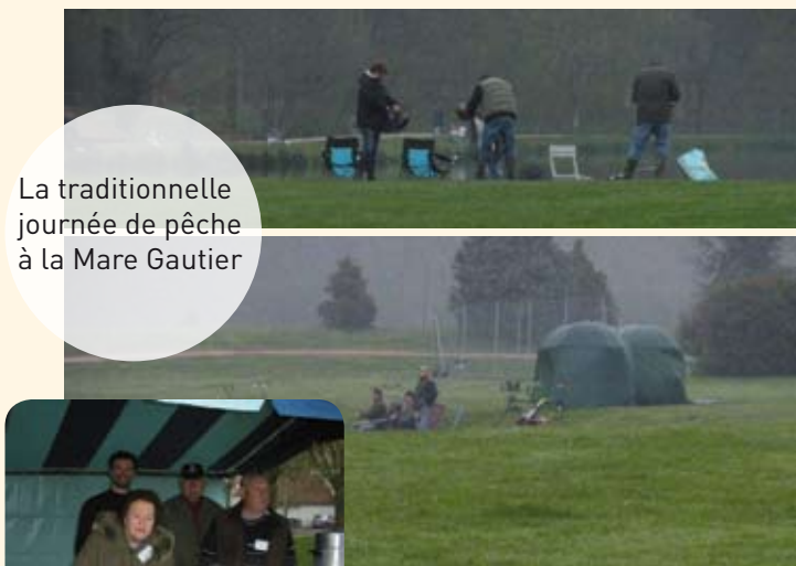
La traditionnelle journée de pêche à la Mare Gautier