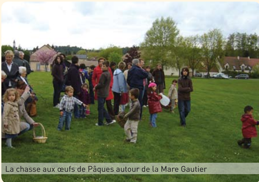
La chasse aux œufs de Pâques autour de la Mare Gautier