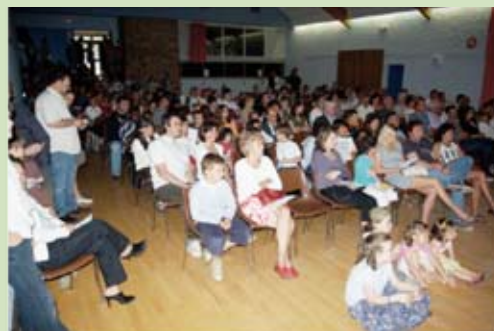
Audition du 31 mai 2009

www.ateliersmusicaux.fr - info@ateliersmusicaux.fr - 06 74 71 61 11