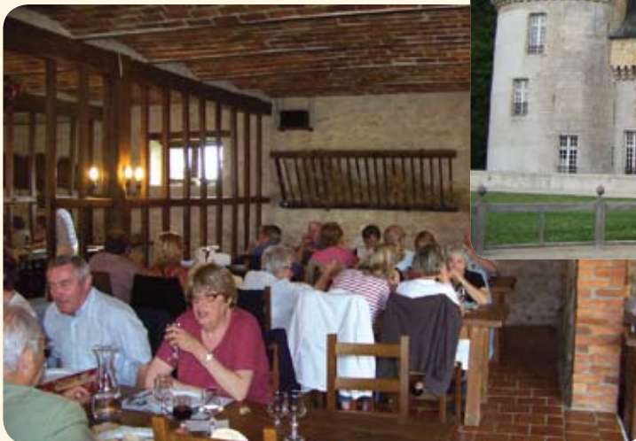
Fin juin, les seniors en balade à Giens et Sully sur Loire