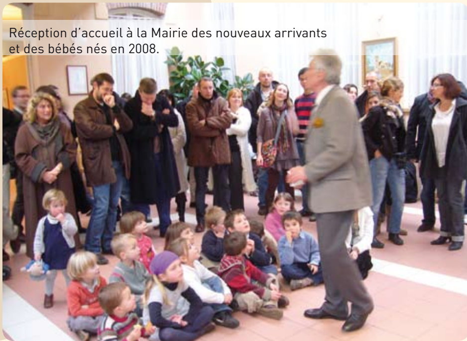
Réception d'accueil à la Mairie des nouveaux arrivants et des bébés nés en 2008.