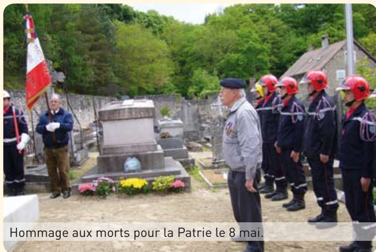
Hommage aux morts pour la Patrie le 8 mai.