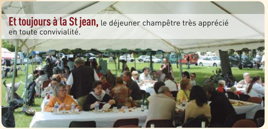
Et toujours à la St Jean, le déjeuner champêtre très apprécié en toute convivialité.