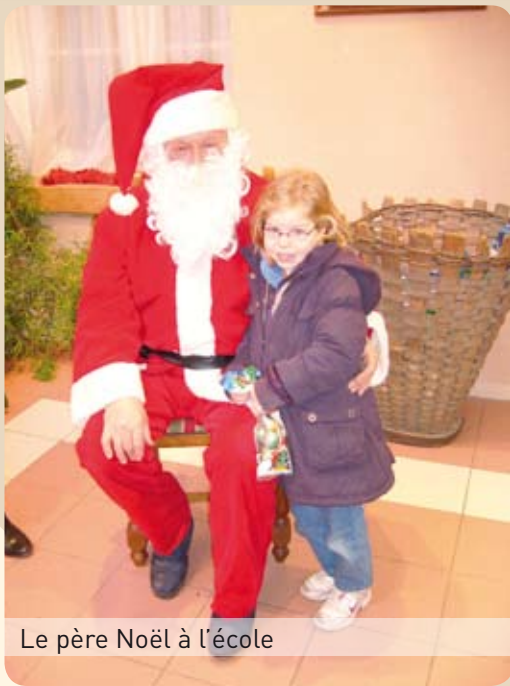
Le père Noël à l'école