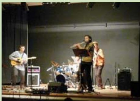
Concert du 18 avril 2009