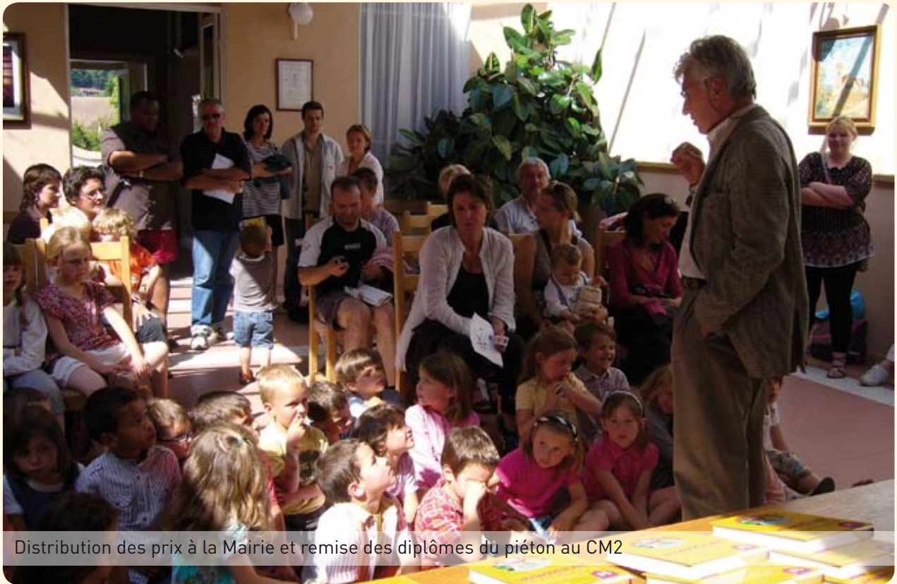
Distribution des prix à la Mairie et remise des diplômes du piéton au CM2