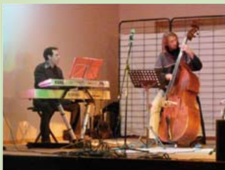
Concert du 14 mars 2009

L'année s'est clôturée par l'audition, très riche en qualité avec une bonne présence des élèves et de parents ; ainsi que par la participation à différentes animations dont la fête de la St Jean de Saint Léger le 21 juin 2009.