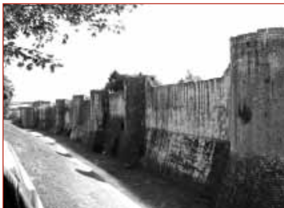
La ville fortifiée