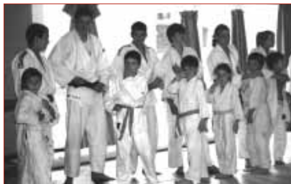
Cours commun, petits et grands pour clôturer l'année.