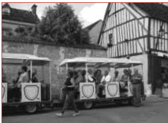
Visite de la cité médiévale en petit train