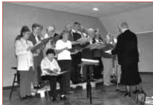
La chorale du jubilé

Le traditionnel dîner paroissial qui fêtait cette année son 16ème anniversaire a eu lieu le 7 octobre à la Maison du Village.