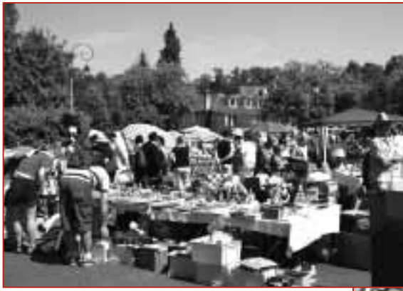
Le traditionnel vide-grenier