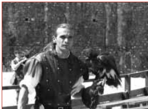
Démonstration de vol de rapaces