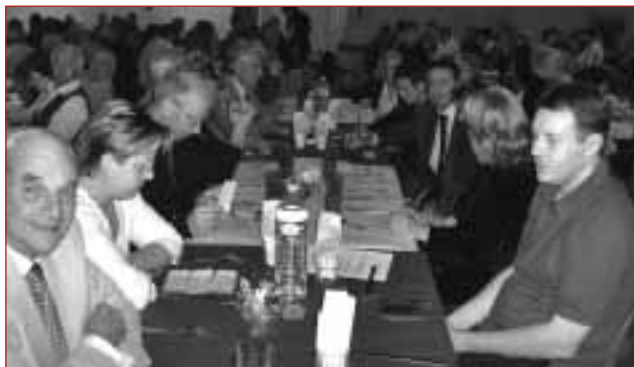
Au dîner paroissial