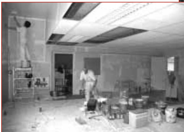
Peinture à l'école maternelle

Ce très beau dessin d' Ysolie Guillot en souvenir de la classe de mer organisée à Saint-Pierre d'Oléron pour tous les élèves de la classe de CM2.