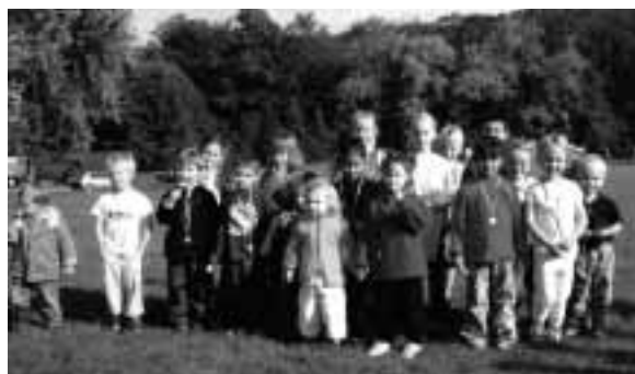
Des récompenses pour de belles performances