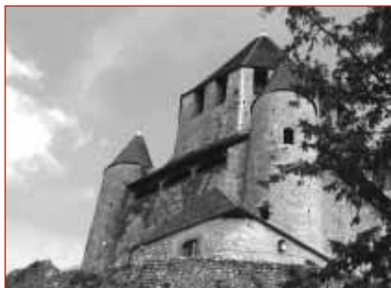
La Tour César