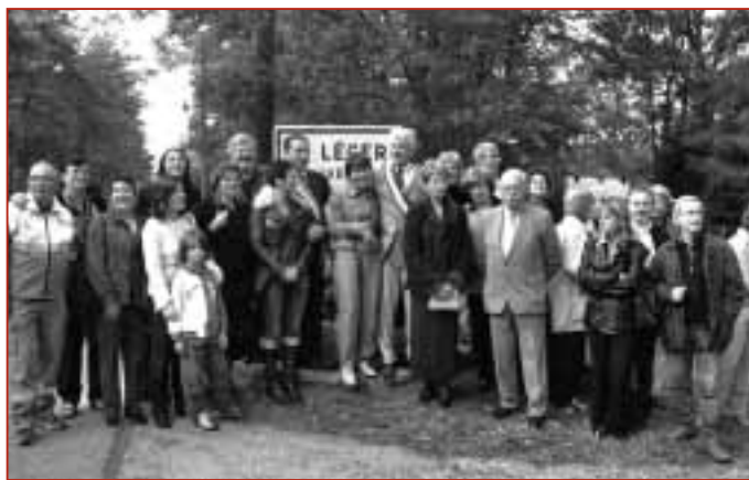
Les membres des deux associations de jumelage