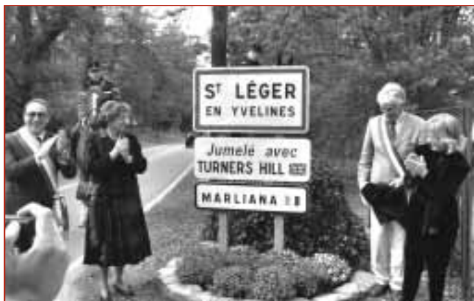
Les deux Maires et les deux Présidentes