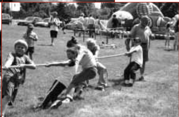
Le tir à la corde