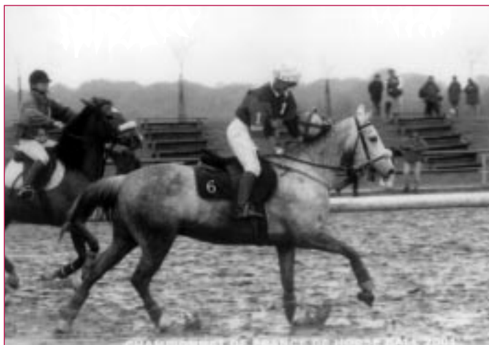
Isabelle en pleine action