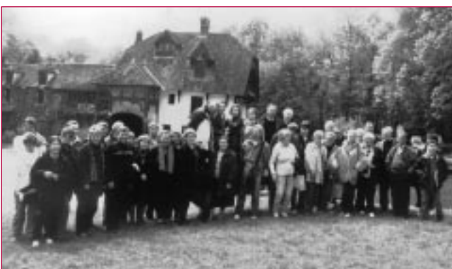
Dimanche, à l'heure du déjeuner