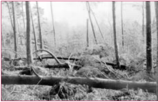
Après la tempête