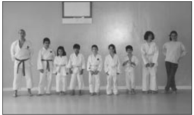
Le professeur et quelques-uns de ses élèves

Pour tout renseignement : A.F.K.S. (Association Française de Karaté Shotokan) Tél. 01 34 85 68 04 ou 06 08 32 21 69