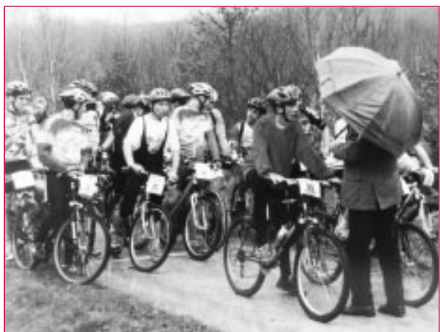
Des compétiteurs très courageux ...

En ce samedi 24 mars 2001 dans la forêt domaniale de Rambouillet aux abords de la commune de Saint Léger en Yvelines s'est déroulé pour la 5 ème édition le challenge léodégarien V.T.T.