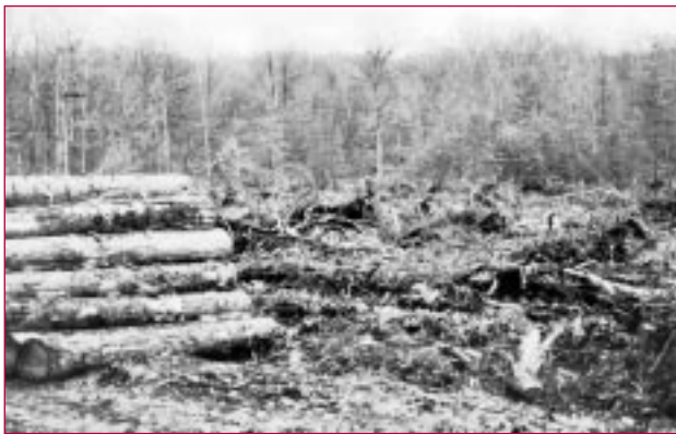
Le même endroit après exploitation