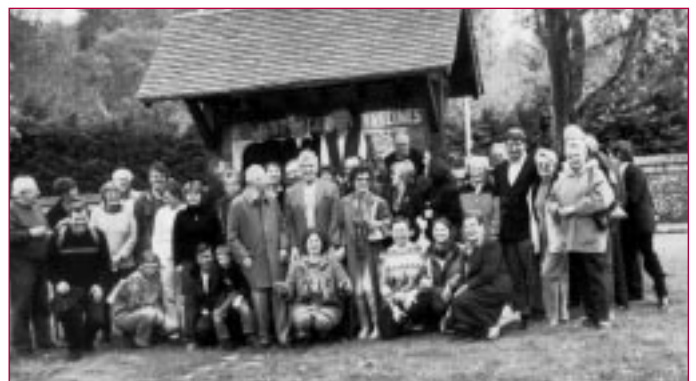
Dernière photo avant le départ

Un buffet de clôture rassembla dans la petite salle de la Maison du village une cinquantaine de personnes avant le départ de nos amis pour une nouvelle visite de musée à Paris et le chemin de fer pour leur domicile.